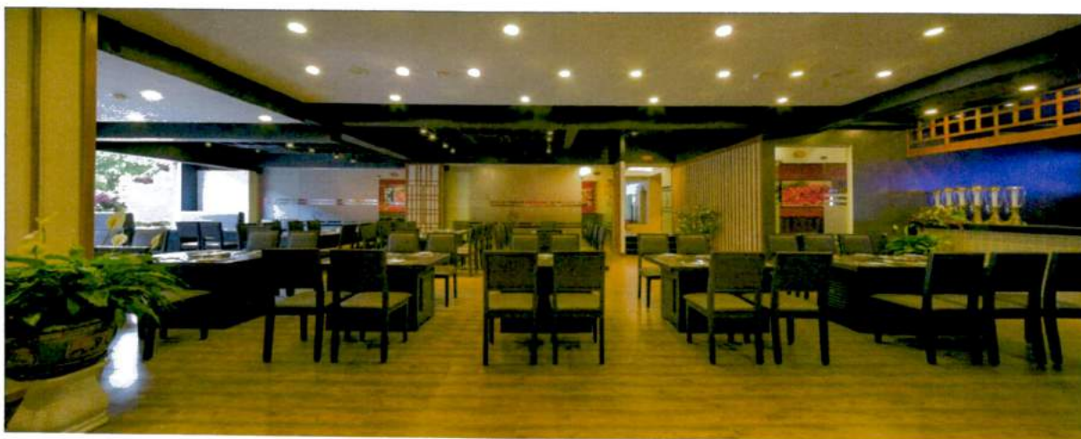
(hình ảnh: Nhà hàng Premium BBQ&BEER không khói tại TTC Premium Đà Lạt)