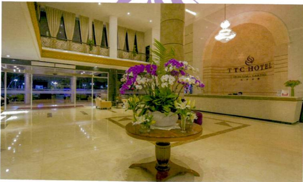
(hình ảnh: sảnh TTC Premium Cần Thơ)