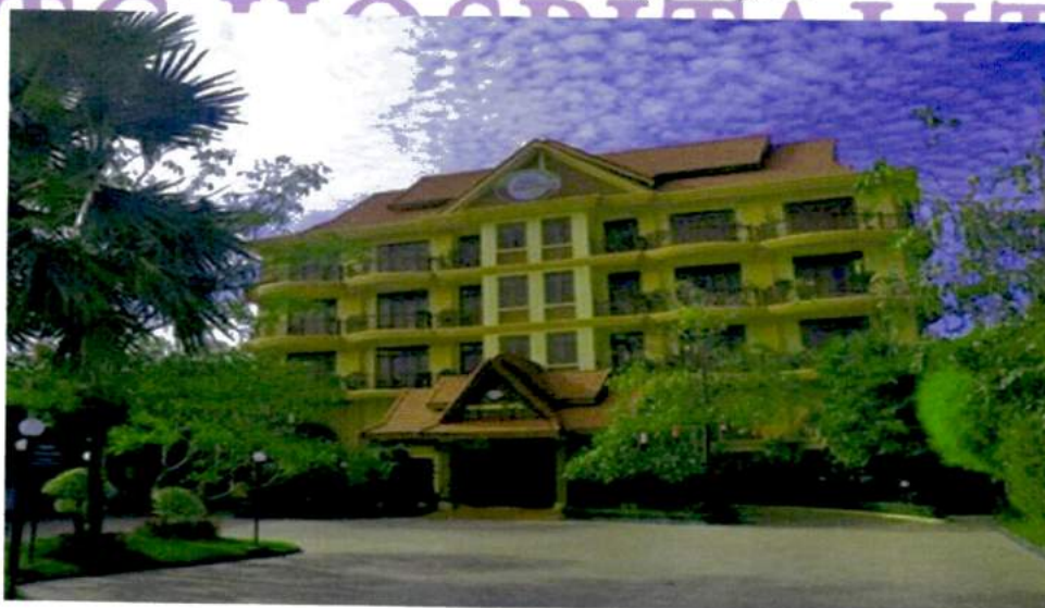
(hình ảnh: Công ty Cổ phần Du lịch Vinagolf Angkor)

Được sự chấp thuận của Bộ Kế hoạch và Đầu tư theo Giấy chứng nhận đầu tư ra nước ngoài số 451/BKHĐT-ĐTRNN ngày 16/6/2011, Công ty Vinagolf (nay là Công ty Cổ phần Du lịch Thành Thành Công) tiến hành thành lập Công ty Cổ phần Du lịch Vinagolf Angkor theo Giấy chứng nhận đăng ký kinh doanh số Co.0602KH/2011 do Bộ Thương Mại – Vương Quốc Campuchia cấp ngày 26/7/2012 với vốn điều lệ 1.900.000 USD trong đó Vinagolf góp 49% vốn. Tháng 7/2013, Công ty Cổ phần Du lịch Vinagolf Angkor tăng vốn điều lệ 2.430.000 USD theo Giấy phép số 3704/BTM ngày 24/6/2013 của Bộ Trưởng Bộ Thương mại Vương Quốc Campuchia, theo đó, Công ty Cổ phần Du lịch Vinagolf Angkor góp thêm 259.700 USD tương đương 5,4 tỷ đồng nâng tổng số vốn góp của Công ty lên 1.190.700 USD và nắm giữ 49% cổ phần trong Công ty Cổ phần Du lịch Vinagolf Angkor.