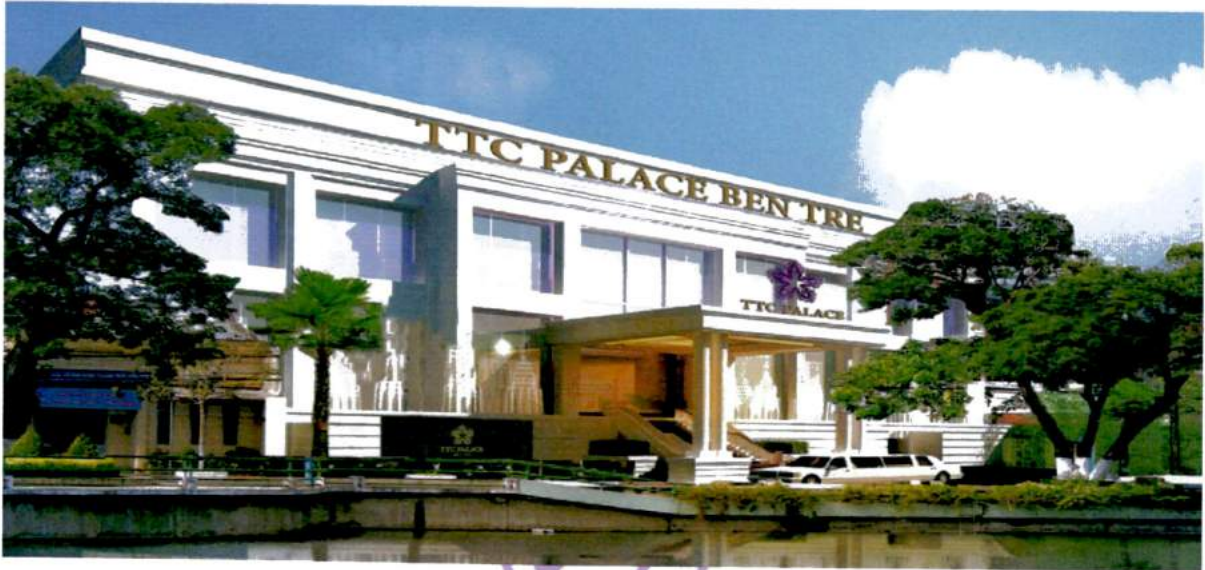
(hình ảnh: Đồng Khởi Palace)