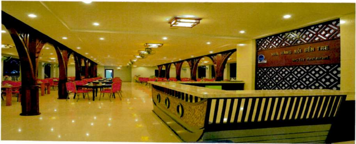
(hình ảnh: nhà hàng nổi Bến Tre)