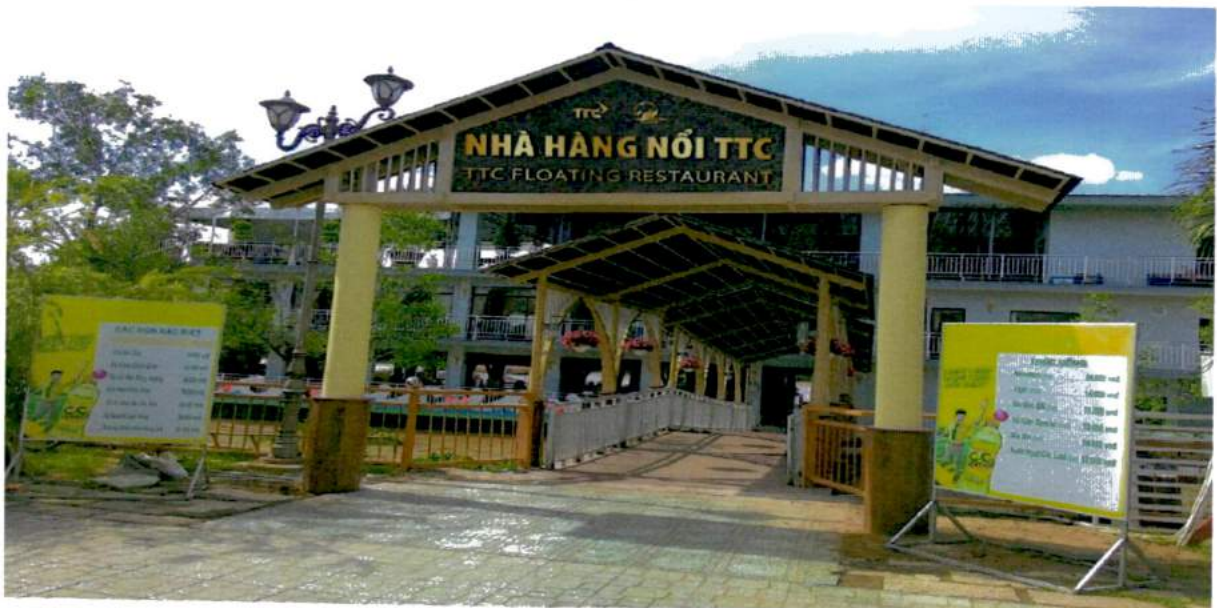
(hình ảnh: Nhà hàng nổi Bến Tre)